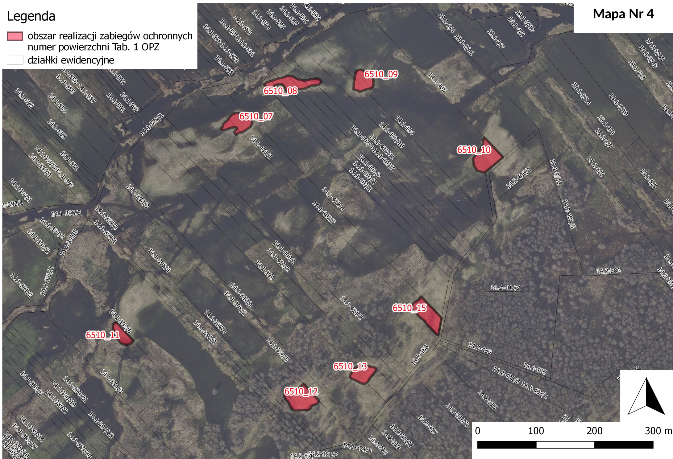
Mapa Nr 4