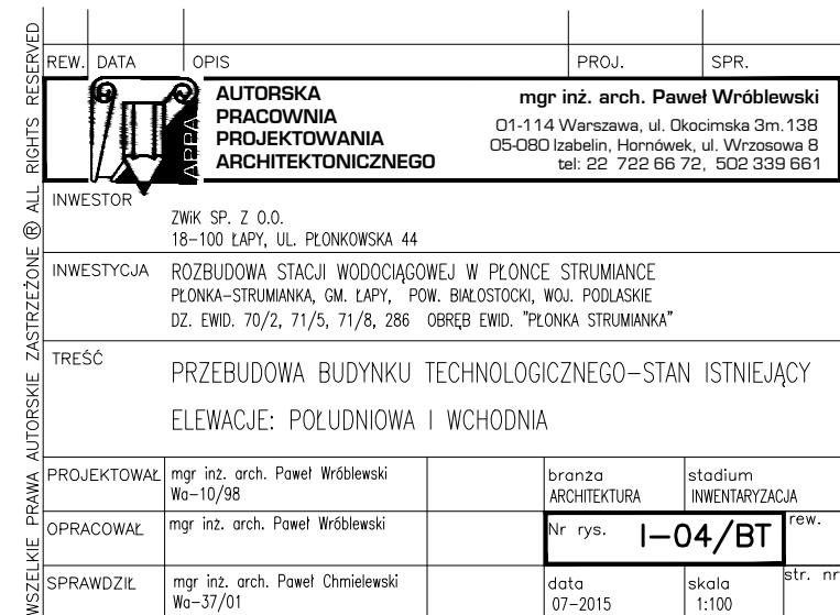
ELEWACJA POŁUDNIOWA skala 1:100

WSZELKIE PRAWA AUTORSKIE ZASTRZEŻONE © ALL RIGHTS RESERVED